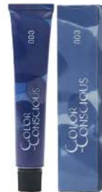
カラーコンシャス グレイライン 43色 染毛剤 (医薬部外品) 80g