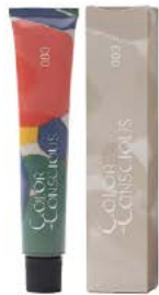
カラ=コンシャス コンシャスライン 27色 染毛剤 (医薬部外品) 80g

ファッションラインとコンシャスラインでは、6・8・10レベルを同明度に設定しています。