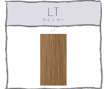
LT:OX 1:2 髪の色を約15Lvまで上げる脱色剤。