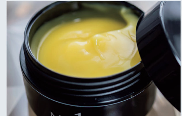
3つのSTEPで使用する「ハリ」が入った最先端ピーリングクリーム「アイセルコスメ ニードルピーリングVA150g【業務用】」

実はそれほど意識しておらず。ただ、とにかく原料や成分が好きなので、世界中の展示会をまわっていたり、常により良いものを探しながらお客様の悩みや要望を聞いていて、原料や成分と結び付く瞬間があるんです。それがトレンドと自然に結びついているのかな、と感じています。