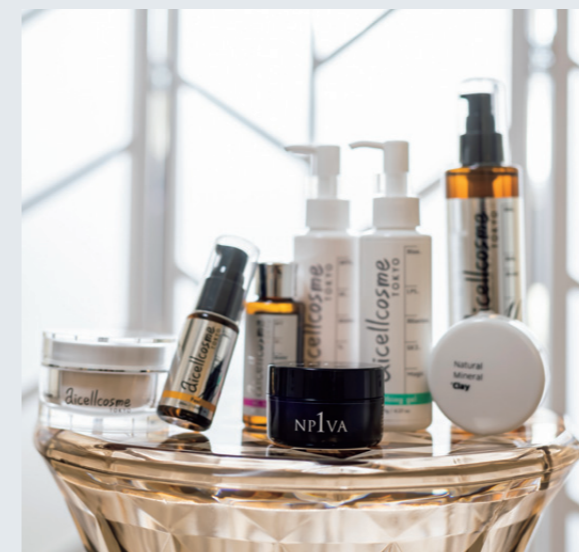
人気の「APPSビタミンローション」など、主要成分が引き立つこだわりの配合で開発されたラインナップ（※一部パッケージデザインが変更になったものもあります）

以前ネットで「ピーリング」の意味を調べたら、トップに、“薬剤で皮膚を薄くすること”とありました。ピーリング単体の意味は、“古い角質を除去する”とか、“ターンオーバーを整える”のはずなのに、ケミカルピーリング=ピーリングという認識になってしまっているんですね。本来は健康な肌に戻すという意味のピーリングという言葉に、“剥離”や“火傷”といったケミカルピーリングのイメージがつきまとうため、ピーリングは怖いと思われる方もいますが、ハーブピーリン