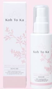
Koh To Ka プレスバスキンウォーター 100ml 定価3,600円 (税込3,960円)

※天然ラベンダーのほのかな香り、合成香料、合成着色料、アルコール、パラベン、鉱物油フリー