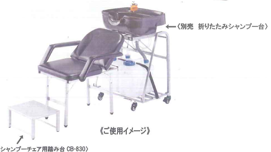
←〈別売 折りたたみシャンプー台〉

〒283-0823 千葉県東金市山田 242-1 TEL：0475-55-1370 FAX：0475-52-3391 URL：http://www.nishimura-mfg.jp