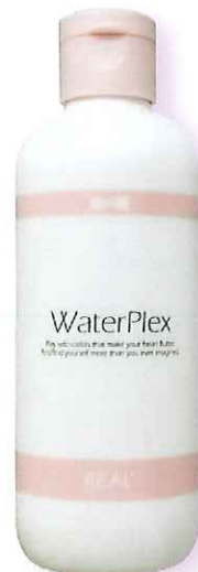
メイリー クロス ウォータープレックス 内容量：230g 3000