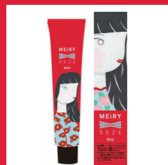
メイリーセゼクロス 酸化染毛剤 第1剤 / 全17色 内容量 90g 医薬部外品 美容室専用