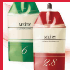
メイリーオキシダイザー エマルジョンタイプ 6% / 2.8% 染毛補助剤過酸化水素 第2剤 内容量 1,100mL 医薬部外品 美容室専用