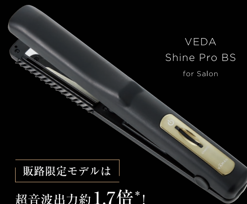
VEDA Shine Pro BS for Salon