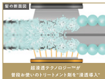
超浸透テクノロジー™が 普段お使いのトリートメント剤を“浸透導入”

新技術、超浸透テクノロジー™により 普段お使いのトリートメントの浸透力を 飛躍的に高めます。有効成分が髪 の深層部まですばやく届き、今まで にないトリートメント効果、持続力を 実感できます。