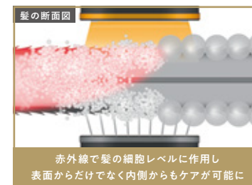
赤外線で髪の毛の細胞レベルに作用し 表面からだけでなく内側からもケアが可能に

赤外線エッセンシャルライト™を 照射することで、髪の毛の内部が温 められ表面だけでなく内側から もケアが可能に。トリートメント の持つ補修力を引き上げ、ハリ・ コシのある美しい髪へと導いま す。