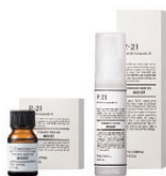
R-21 ストレート ヘアオイル モイスト