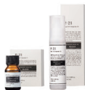
R-21 ストレート ヘアオイル グロス

10mL/980円(税込 1,078円) 100mL/3,200円(税込 3,520円)