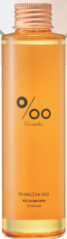
150ml / 3,300円