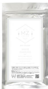
ホワイト （クリアー）