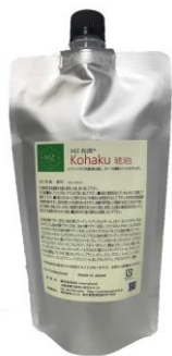
コハク （ボリュームアップ効果）