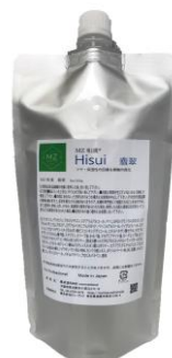
ヒスイ （ボリュームダウン効果）