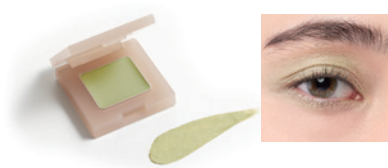
lime green 125 ライムグリーン