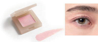
pink halite 153 ピンクハーフライト