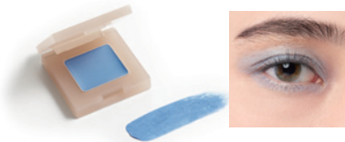
horizon blue 185 ホリズンブルー