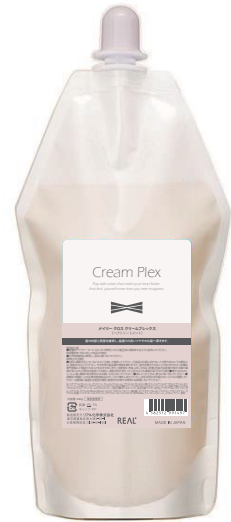
メイリークロス クリームプレックス 内容量：400g

ヘアカラー施術によるダメージ低減と共に、 「柔らかさ」と「ツヤ」を与える酸化染毛剤用補助料です。 ダメージを低減することで、 繰り返しのカラー施術や高強度カラーにも楽しめます。 「柔らかさ」と「ツヤ」を向上することで、 お客様に効果を実感いただける質感に仕上がります。