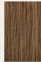
クリームプレックス未使用