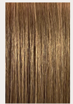
クリームプレックス使用

[ご使用方法] ご使用時に水で希釈し、髪全体に馴染ませるように塗布してください。