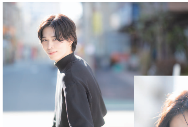
+ hunt grease / + hunt bb