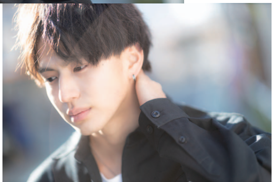
+ hunt wax / + hunt bb