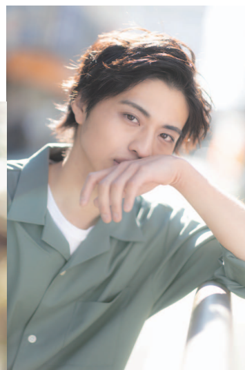
+ hunt gel / + hunt bb