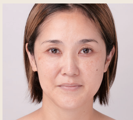
スキンケア後の素肌