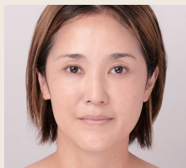
本品で仕上げた状態