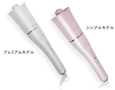
プレミアムモデル