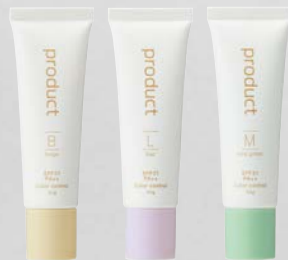
beige ベージュ lilac ライラック mint green ミントグリーン