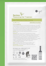
【ドライ/ノーマル】 オーライト ヘアトリートメント BB