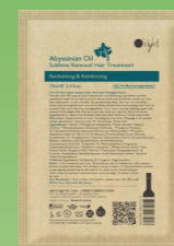
【ダメージヘア】 オーライト ヘアトリートメント AB