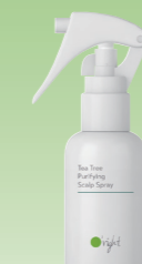
オーライト スカルプケア PU