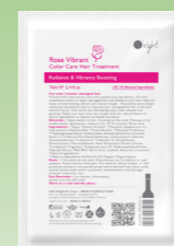
【カラーリング】 オーライト ヘアトリートメント RV