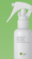
オーライト スカルプケア C&R