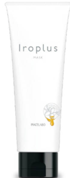
フォーミュレイト イロプラス マスク