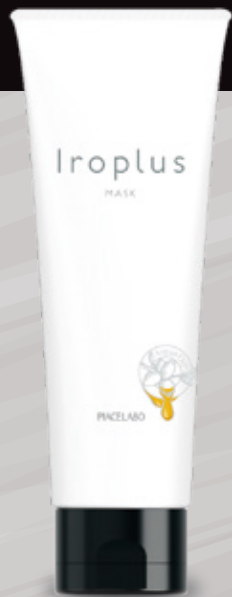
フォーミュレイト イロプラス マスク