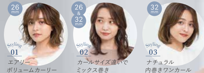
Styling 01 エアリー ボリュームカーリー