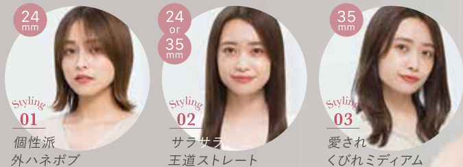
Styling 01 個性派 外ハネボブ