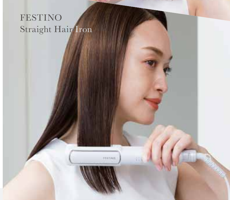
FESTINO Straight Hair Iron