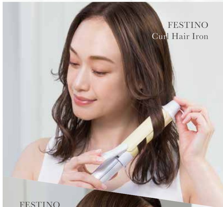
FESTINO Curl Hair Iron